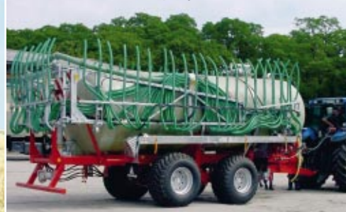
Citerne à lisier en polyester