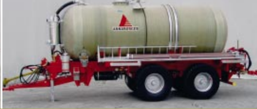
citerne à lisier

pour l'épandage de lisier et de différentes matières liquides