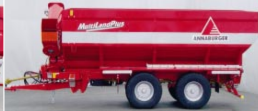
superstructure pour le transvasement

pour la récolte des céréales, du colza et de tournesol