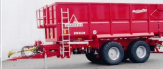
superstructure avec benne

pour toutes les récoltes et pour le transport d'autres marchandises