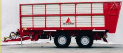
superstructure pour l'ensilage