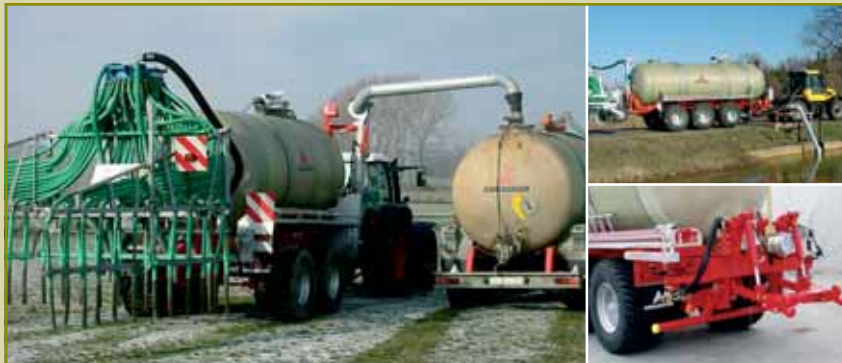
Hígtrágya tartály komponens

A tartályos felépítmények is gond nélkül beilleszthetőek a MLP rendszerbe. Hatékonyan használhatók nagy térfogatú szállítójárműként, valamint különböző adapterekkel, szántóföldi munkagépként. A hígtrágya elosztása és adagolása kitűnő. Nagy előnye a tartály kis önsúlya. Felszerelhető sebességarányos szabályozással.